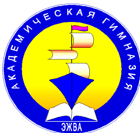
Рисунок 1. Эмблема гимназии.

Создавая модель внеурочной деятельности, мы решили взять за основу эмблему гимназии, которая символизирует корабль жизни, плывущий через море знаний под парусами мечты, в лучах восходящего солнца, обозначающего счастье (Рисунок 1).